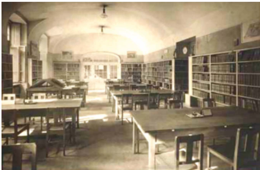
1. kép. A Fővárosi Könyvtár olvasóterme a Reáltanoda első emeletén.