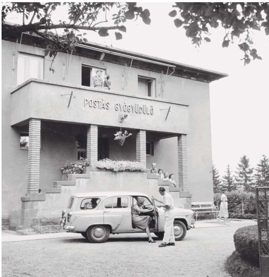
Postás gyógyüdül, 1960-as évek.