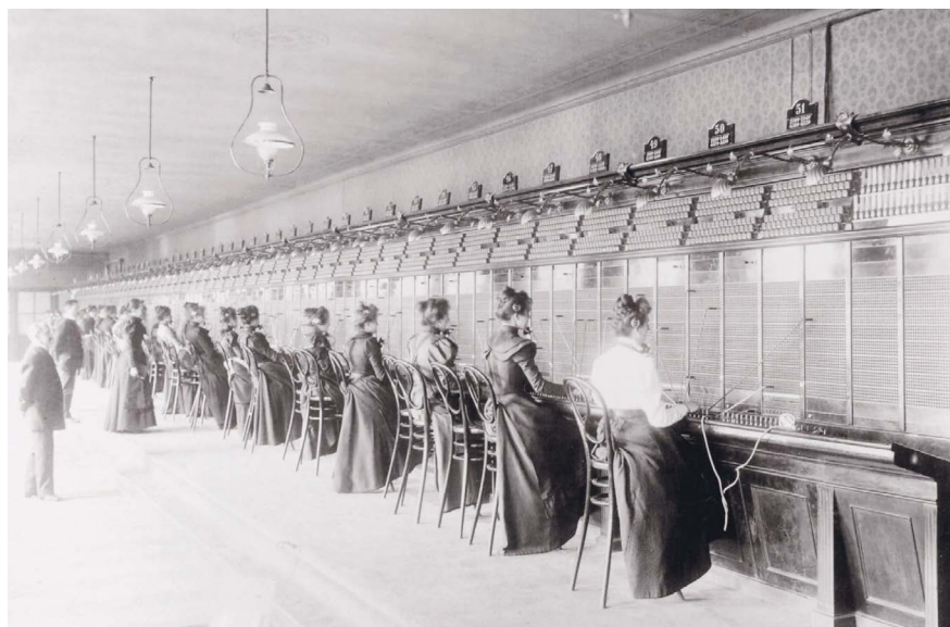
Szerecsen (ma Paulay Ede) utcai kapcsolóterem a kezelőnőkkel, 1900 körül.

A nők távbeszélőnél való alkalmazása egészen az 1990-es évekig folytatódott, csak ezt követően váltja fel az automata rendszer az emberi munkát.