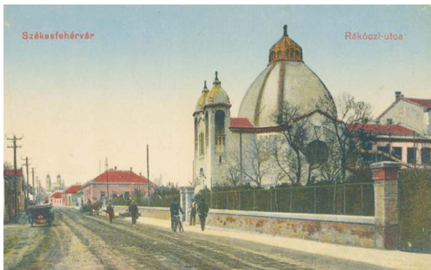
5. kép: A Jézus Szíve-templom egy korabeli képeslapon