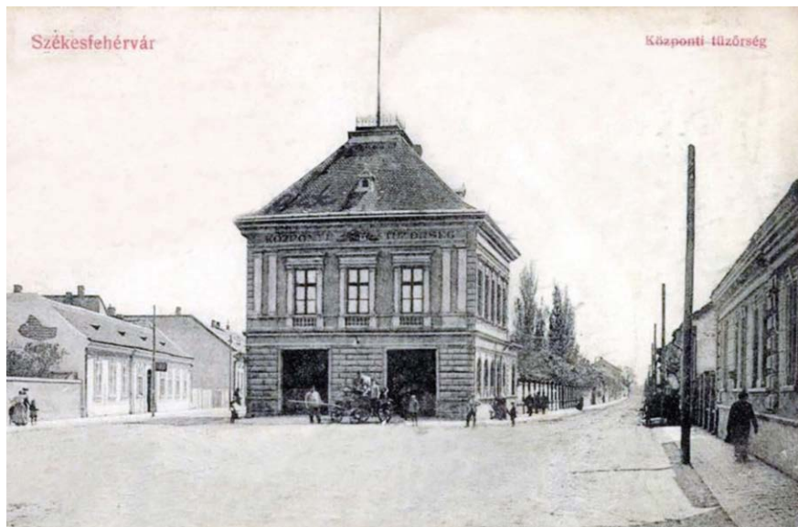
6. kép: A központi tűzörség épülete

ben állítottak, amikor az őrtanya külső megjelenésében is megújult. 84 A második világháború során keletkezett károkat 1945 áprilisában lakossági segítséggel sikerült helyrehozni. A gépkocsiparkot működőképessé tett katonai terepjárókkal egészítették ki.