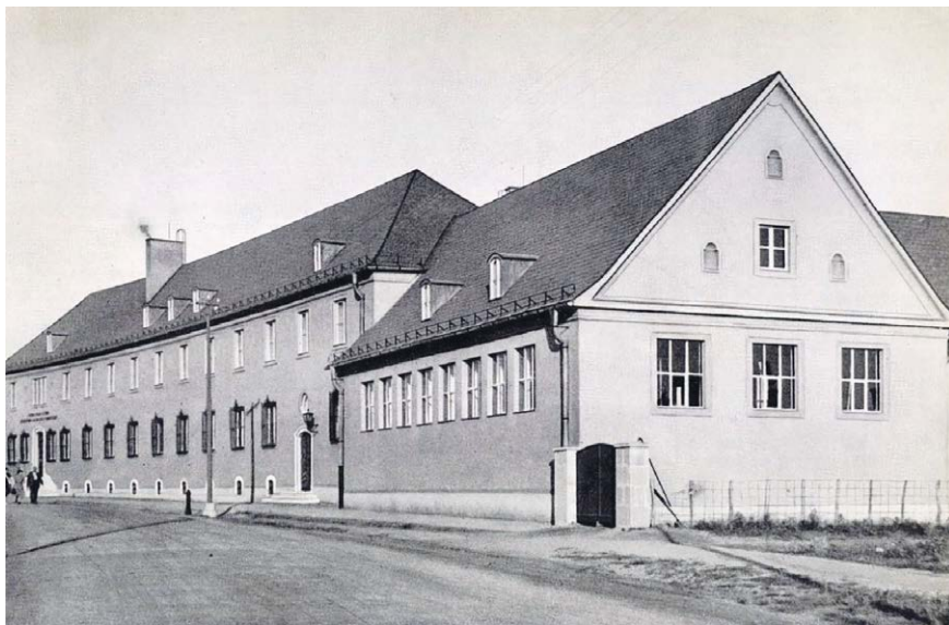
3. kép: Magyar királyi Szent István középiskola gazdasági tanintézet homlokzata (1941)

A tér átépítése magába foglalt egy tágabb értelemben vett csapadék-rendezési és útburkolat-kialakítási szándékot is. Több környező utca kapott kerámiaburkolatot, illetve gyalogjárda is kiépültek. 32