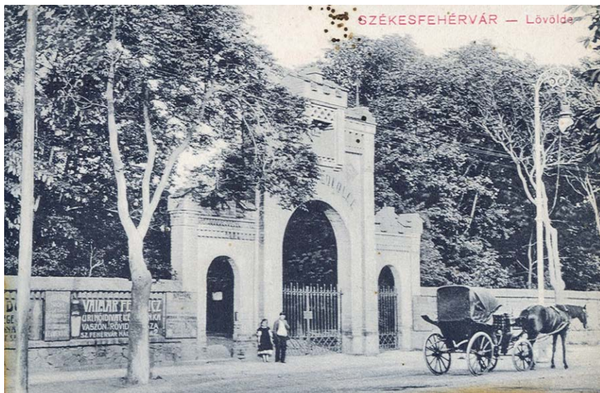
1. kép: A lövöldekert bejárata

is. 1879-ben részben a lövölde kertje adott otthont az országos ipar-, termény-, szépművészet- és állatkiállításnak. 13