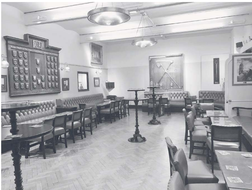
2. kép: A Keys Pub a Towerben

A Tower régebben három kocsmával is dicsekedhetett, a King's Head-del , a Golden Chainnel és a Cold Harbourral . 41 Napjainkban csupán egy található itt, a Keys Pub . Ezt az egyet viszont nagy becsben tartják, a nyilvánosság számára elzárt területen, s ide csak egy Yeoman Warder meghívásával lehet bejutni.