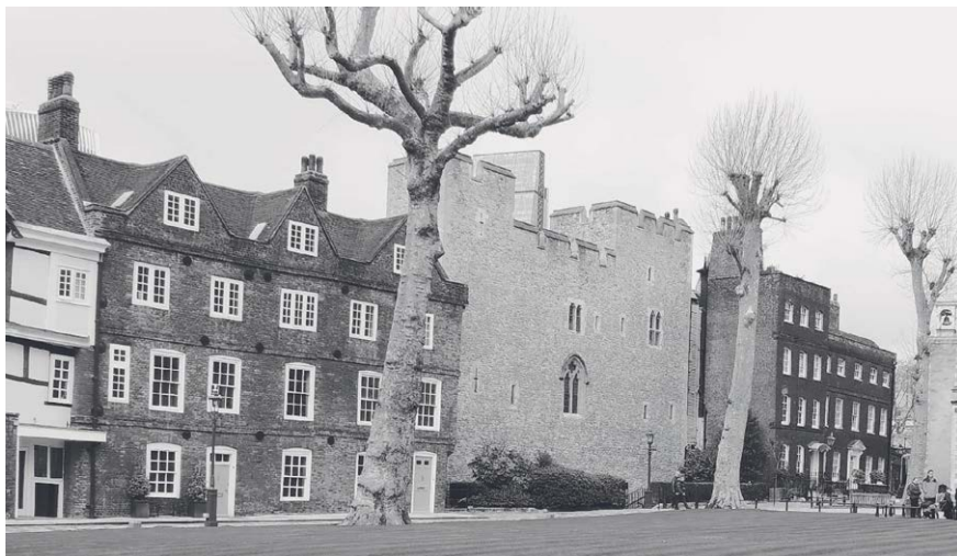
1. kép: Tower Green 4–5. a baloldali épület.

Az épületeket 1685-ben építették át a Hadnagy istállóiból. A házak építészeti stílusa vegyes, az 1666-os Nagy Tűzvész előtti időkből származó, illetve György-korabeli (1714–1830/1837) elemek is felfedezhetőek rajtuk. Jelenleg dendrokronológiai vizsgálatok folynak az épületek több részéből vett famintákból, illetve festékmintavétel és az álló épületek régészeti feltárása zajlik. 24