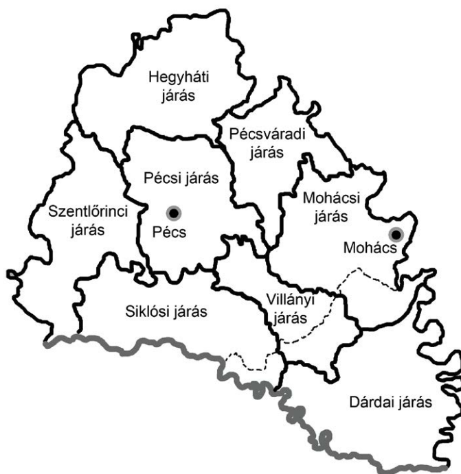
1. térkép. Baranya vármegye járásai 1941 augusztusát követően